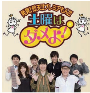
読売テレビ「土曜はダメよ」