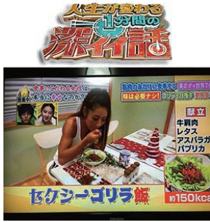
日本テレビ「深イイ話」