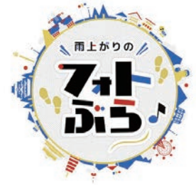
関西テレビ「雨上がりのフォトぶら」