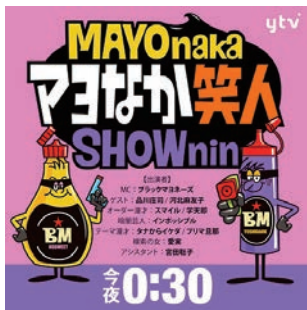
読売テレビ「マヨなか笑人」