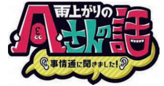
朝日放送「雨上がりのAさんの話」