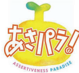
読売テレビ「あさぱら！」